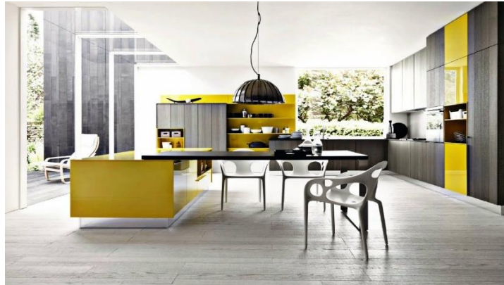
صورة (3) توضح استخدام الالوان في المطابخ

اليومي كالأصفر فهو لون مبهج و مثير في نفس الوقت .