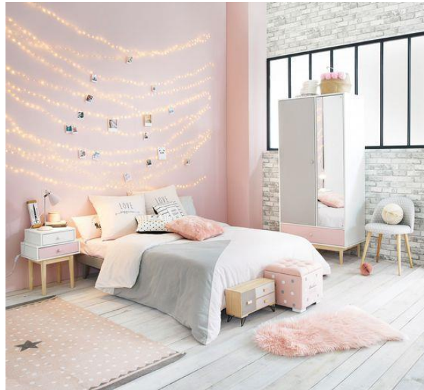
صورة (7) توظيف الالوان في غرف الاطفال

غرفة نوم الاطفال يفضل استعمال الألوان الدافئة المفعمة بالحيوية لها كالوردي .