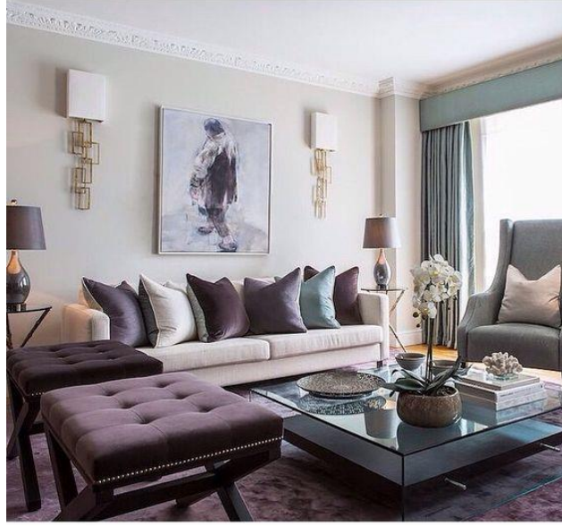
صورة (8) دمج الالوان في صالات استقبال الضيوف

استقبال الضيوف تناسبها الألوان المثيرة و المبهجة يمكن استعمال الاحمر في هذا الفراغ .