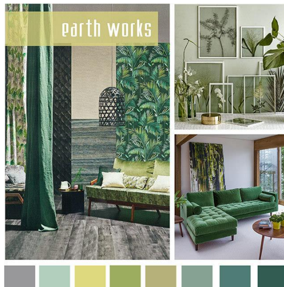
صورة (5) توضح الالوان في غرف المعيشة

غرفة المعيشة ثلاثمها الألوان الباردة حتى تتناسب مع جميع أذواق أفراد الأسرة فاللون الاخضر يتصف بالبرود مع القليل من الدفء يعطي شعور الالفة بين الافراد .