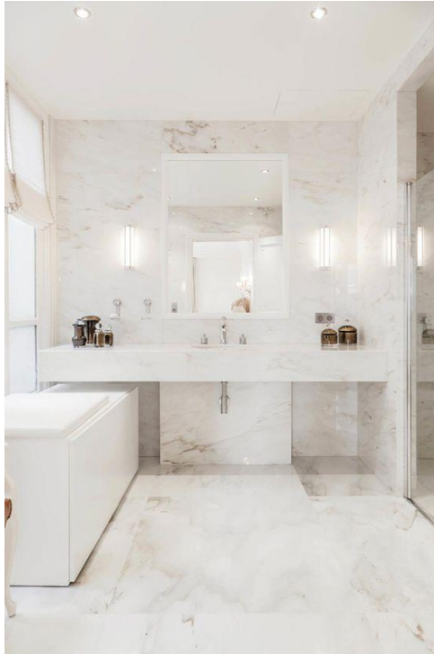
صورة (4) توضح الالوان المستعملة في الحمامات

يحتاج الحمام إلى ألوان واقعية و حيادية فغالبا ما يسيطر عليه اللون الابيض و الرمادي و لكن يمكن ان يتم تصميم حمام مميز و ملفت بإضافة بعض الالوان الباردة .