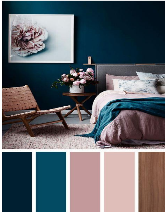
صورة (6) توضح استخدام الالوان في غرف النوم الرئيسية

غرفة النوم الرئيسية تحتاج إلى الألوان الهادئة و المريحة كالأزرق في درجات السماء .