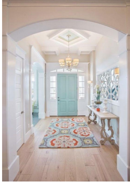
صورة (2) توضح دمج الالوان في المداخل

المدخل: يعبر على هوية الأفراد داخل هذا الفراغ و اكن تناسبه الألوان الدافئة أكثر .