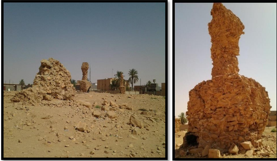
صورة(5) تسمودين الأصنام عن : (يوشع ب . ، (2011م) ، ص 112).

تقدم لوحة السيدة الجالسة على كرسي (الصورة 6) رسم جميل لامرأة ليبية من غدامس، وتظهر السيدة وهي في حالة تعبد، وخلفها وصيفتها، وذلك من خلال رسم حجم أصغر للوصيفة، كما يؤكد الجلوس على الكرسي ووضع الأقدام على مسند للأقدام على المستوى الرفيع لهذه المرأة، كما تشير سعفة النخيل بيد المتعبدة، وشكل الزخرفة الظاهرة على القوس الموجود أمامها على مهارة في الأسلوب الفني، ودرجة عالية من الرقي، والتحضر للمدينة ( Bates, O; , 1970, p. 128)(الأثرم، 2003، صفحة 87).