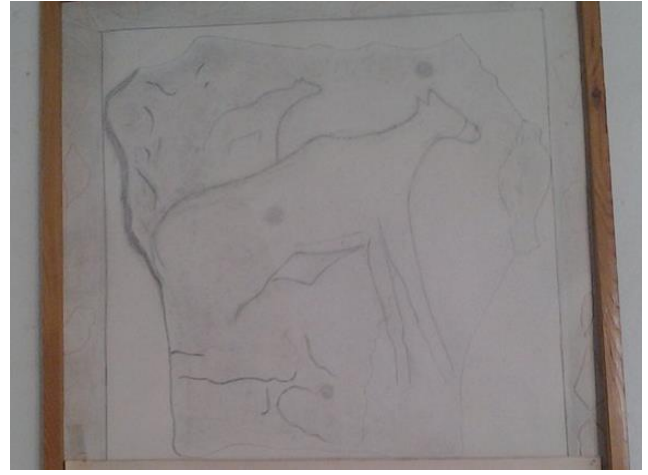
(الصورة 2) ثور رسم على الحجارة موجود بمتحف غدامس عن : ( يوشع ب . ، 1971م ، ص 105 ) .