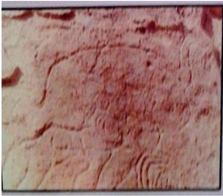
(الصورة 3) لطير النعامه عشر عليه في منطقة السانبات عن: ( يوشع ب، 1971م ، ص 107)