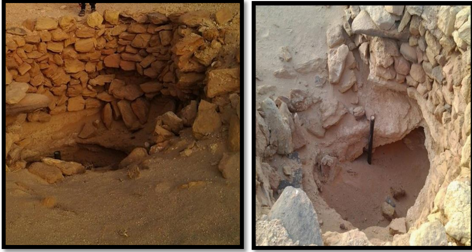
الصورة (8) مقابر الشهداء عن (بشير قاسم يوشع، (2002)، ص 85).