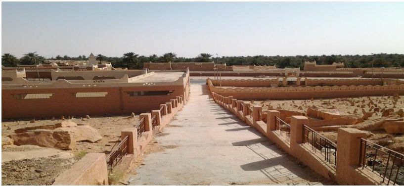
الصورة (1) مقبرة المدينة ، عن : (يوشع ب. ، غدامس وثائق تاريخية تجارية اجتماعية ، 1971م، الصفحة 103)

تميزت مدينة غدامس بوجود ثقافات مختلفة، منها ثقافة العصر الحجري القديم، حيث تم العثور على بعض الشواهد الموجودة بالمدينة من نقش حجري لحيوانات تعود لعصور ما قبل التاريخ، فهناك نقش لحيوان الثور على حجارة أعيد استعمالها كعتبة لمنزل في المدينة القديمة، ونقش آخر موجود حاليًا بمقبرة في المدينة (صورة 1) لحيوان الثور مع حيوان أصغر منه في أعلى اللوحة، و يعتقد أن يكون ذئبًا، وقد تم رسمه، و الرسمة موجودة بالمتحف (الصورة 2)، كما عثر في منطقة السانبات على رسومات صخرية لعدد من الحيوانات منها الأفاعي والنعام (يوشع ب.، غدامس وثائق تاريخية تجارية اجتماعية، 1971، الصفحات 12-13)(الصورة 3).