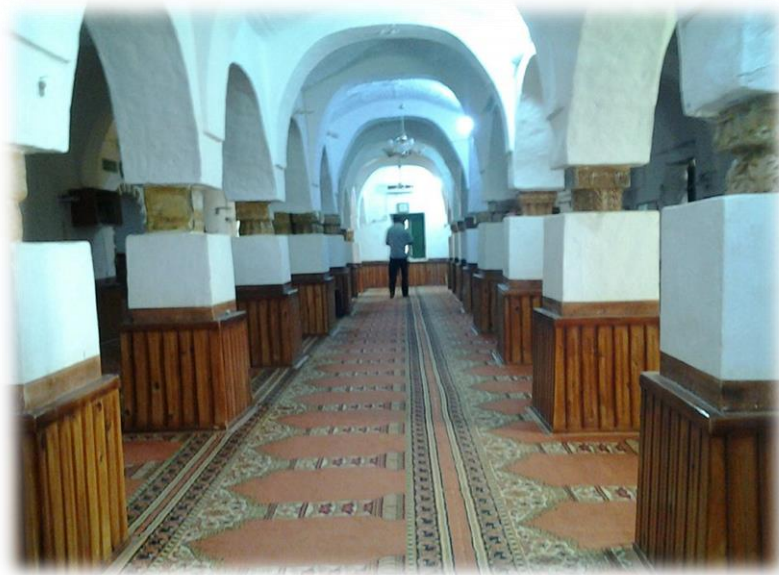
(الصورة 4) أعمدة وتيجان أعيد استخدامها في البناء زيارة ميدانية بتاريخ 23 /7/2017.