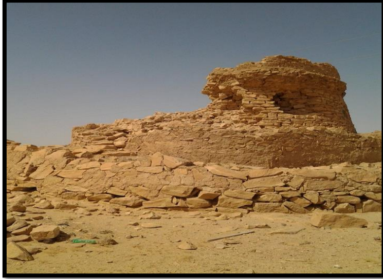
الصورة (7) قصر مجدول عن : (بشير قاسم يوشع، (2011)، ص102).