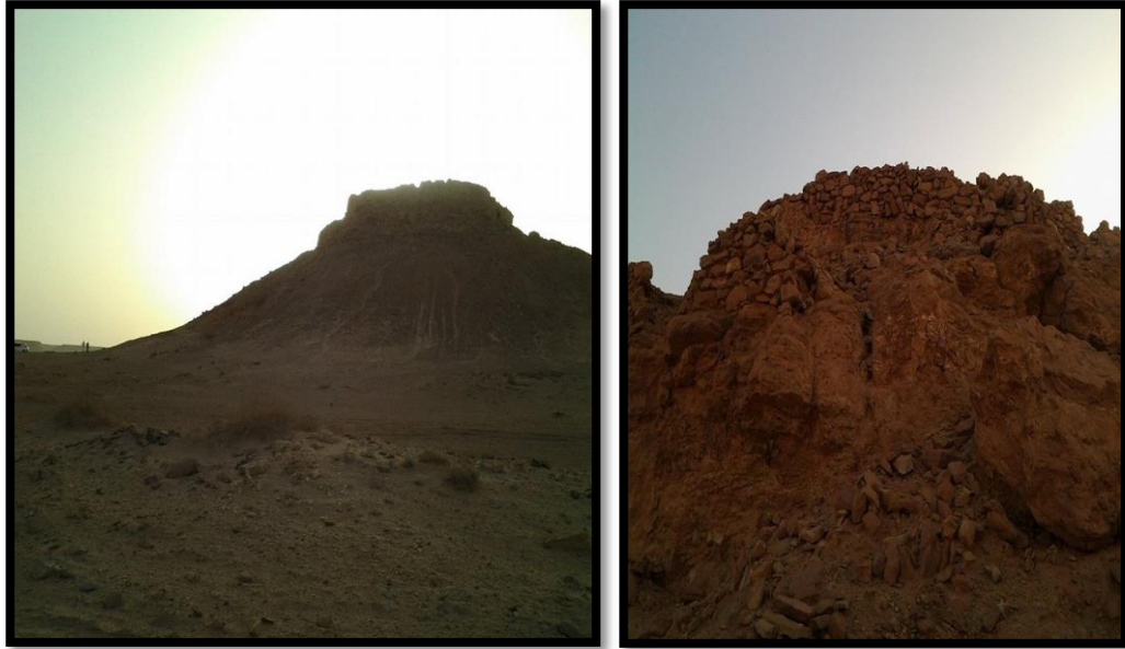
الصورة (9) قصر الغول عن : (يوشع ب، (2002)، ص 88).