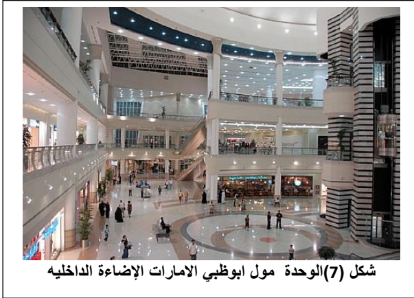
شكل (7) الوحدة مول ابوظبي الامارات الإضاءة الداخليه