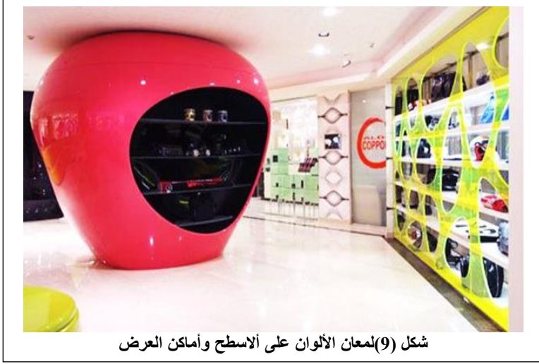
شكل (9) لمعان الألوان على الأسطح وأماكن العرض

بالتدرُّج اللوني، ويستفاد بذلك في العروض المختلفة المتنوّعة، وخلاف ذلك تباين الألوان، لعدم ارتباطها بلون مشترك، فالألوان المتباينة تتميز بشدتها المبهرة، ممّا يكون المطلوب فيها لفت وجذب،