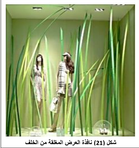
شكل (21) نافذة العرض المغلقة من الخلف

الزجاجية القليلة التي تحتاج إلى مسطحات عرض صغيرة، وهي ملائمة لنوعيات خاصة من الأنشطة التجارية، وتتصف الواجهة المغلقة ذات الفتحات شكل (21) الزجاجية القليلة بالتآلف القوي والتجانس مع واجهات المباني بشكل عام، كما أنها تزيد من جمال الشارع التجاري ولكن تفتقد هذه الواجهات من جهة أخرى إلى العمق الفراغي، وبذلك تعد نافذة العرض المغلقة من الخلف محدودةً إلى حد ما من حيث مجال الرؤية