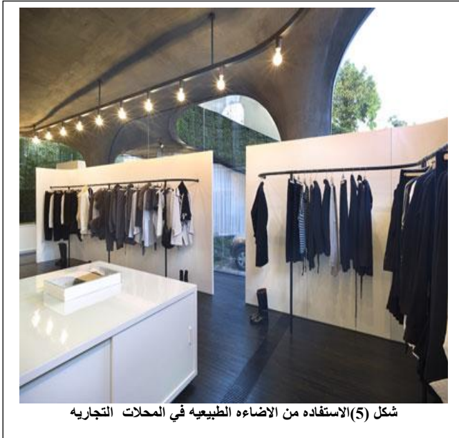
شكل (5) الاستفادة من الاضاءة الطبيعيه في المحلات التجاريه

من مميزات الإضاءة الطبيعية أنها تعمل علي توضيح معالم الفراغ، وتحديث انسجاماً بين الضوء والظل، وتجعل مسطّحات محدّدات الفراغ الأفقية والرأسية متباينة، من خلال انتشارها وانعكاساتها المختلفة، زد على ذلك رخصها كمصدر طبيعي متوفر وموجود في أي مكان عند ساعات النهار، وهذه نقطة مهمة، وكأحد المحدّدات المؤثرة على التصميم المعماري، بجانب تأثيرها