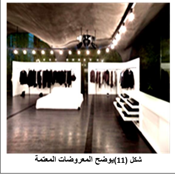
شكل (11) يوضح المعروضات المعتمة

الخلفيات ومستويات العرض هي المستويات الرأسية والأفقية المساعدة في عمليات العروض المختلفة، حيث يمكن أن تكون متباينة مع العرض، وقد يكون هذا التباين تبايناً في الخامة والملمس، أو في الإضاءة، أو في اللون، أو في الوحدات التشكيلية كالرسوم على الخلفيات، أو في واجهات المحلات، والتباين في الخامة والملمس يتم من خلال الخلفيات ومستويات العرض بالنسبة للمعروضات شكل (10).