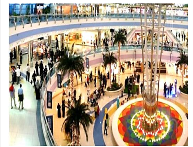
شكل (2) يوضح التفاعل الاجتماعي داخل المركز التجاري بمارينا مول