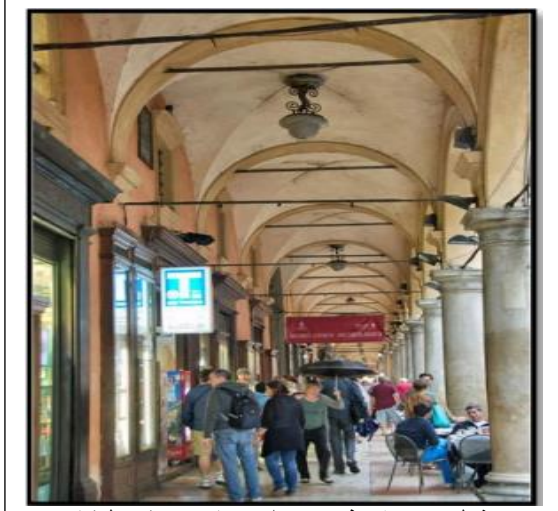
شكل (17) رواق تفتح به محلات تجاربه بمدينة بولونيا

تشتمل هذه الواجهة على ممر مظلاً مسقوف بين نوافذ العرض، تعمل كمنطقة اتصال وتمهيد بين