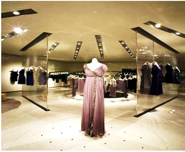
شكل (8) تركيز الإضاءة على المعروضات

وسط حيادي للإضاءة، يجب أن تكون في مستوى بصري يسمح برؤية واضحة للمعروضات، فكلما زادت درجة غمقان لون المعرضة، كلما وجبت زيادة كثافة الضوء الموجّه إليهما، ويجب احتواء فراغ العرض على مساحات غامقة، وفتحة لإبراز المعرضات (1) شكل(8).