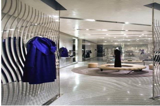
شكل(26) زجاج به نسبة من العتمة لا يستخد في اماكن العرض