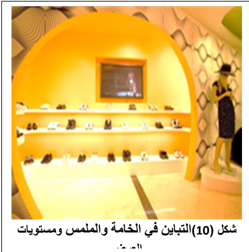
شكل (10) التباين في الخامة والملمس ومستويات

كأن يكون خشناً أو ذي وبرة في حالة تكون المعروضات ناعمة والملمس، أو مصقولة كالمجوهرات والخزفيات والزجاجيات وغيرها، وأن تكون ناعمةً لمساءً في حالة خشونة ملمس المعروضة، والتباين في الإضاءة، يتم بأن تكون الخلفيات ومستويات العرض مضيئة وواضحة، في حالة أن تكون المعروضات ذات ألوان قاتمة ومعتمة، أو بأن توجه وتسلط عليها إضاءة مركزية معينة شكل (11).