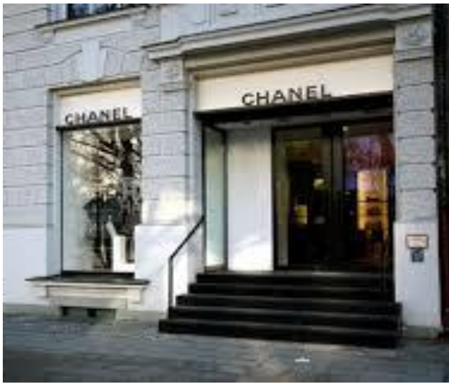
شكل (19) واجهه لمحله تجارى كلاسيكى نوافذ العرض بها صغيرة

يعتمد تصميم هذا النوع من الواجهات على مساحة نوافذ العرض الزجاجية الصغيرة نسبياً، أمّا باقي