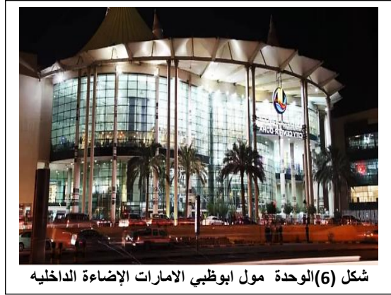
شكل (6) الوحدة مول ابوظبي الامارات الإضاءة الداخليه

إنَّ إضاءة الوحدات ذات البعدين، والأعمال المجسمة ذات الثلاث أبعاد، تكون بإضاءة مركزية بالإضافة للإضاءة العامة، ويتم ذلك بإضاءات موجهة ثابتة أو متحركة، أو مصادر إضاءات وهاجة داخلها عاكس كاملة التحكم في كمية الضوء الموجه وشدته، بجانب ذلك استخدام قنوات ضوئية بالأسقف الأساسية أو الثانوية بداخلها لمبات فلورسنت ذات أغطية ناشرة للضوء، وهي تجمع ما بين الرؤية الجيدة، و التشكيل الفني، وأيضاً تجنب التسطیح؛ لأنه يتسبب في تلف