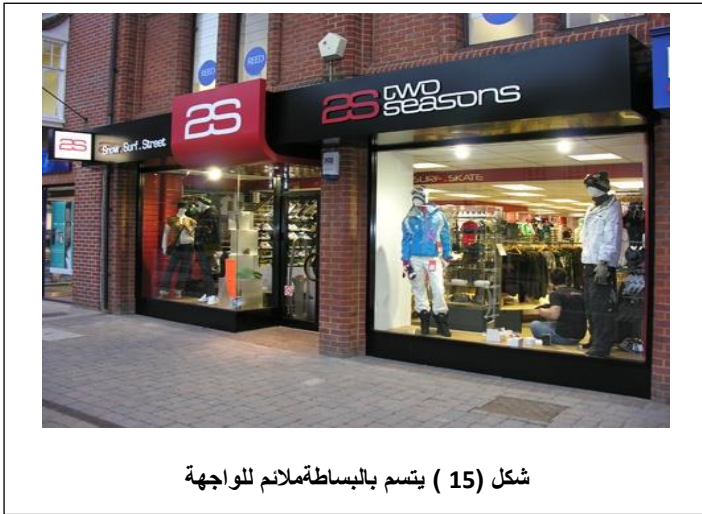
شكل (15) يتسم بالبساطة ملانم للواجهة

ملائمة الواجهة للطراز المعماري للمبنى، ويختلف تصميم الواجهة تبعاً لنمط الحي حيث تؤثر المناطق ذات المستوى الاجتماعي والاقتصادي المرتفع على نوعية السلع المباعة وأسلوب عرضها، وذلك لأنّ فئة تلك المحال تتعامل مع شريحة من العملاء ذات مستوى اجتماعي ومادي مرتفع، وبالتالي تتميز واجهات هذه المحال بالبساطة في التصميمات وعدم المغالاة في البروز في الهيكل الدعائي والمستويات والكتل، كما تتميز بمستوى مرتفع في استخدام الخامات ووسائل التركيب والتشطيب، كما تتميز نوافذ عرضها في انتقاء بعض المعروضات القليلة العالية الجودة، وعرضها بأسلوب درامي يعتمد على الفكر في التصميم، دون اللجوء إلي حشد النافذة بمعروضات كثيرة، كما يؤثر نمط الحي الشعبي على تصميم الواجهة وأسلوب العرض، حيث يعتمد في جذب العميل أولاً وأخيراً على نافذة العرض العريضة بالقدر المستطاع وعرض أكبر قدر من المعروضات في النافذة شكل (15)