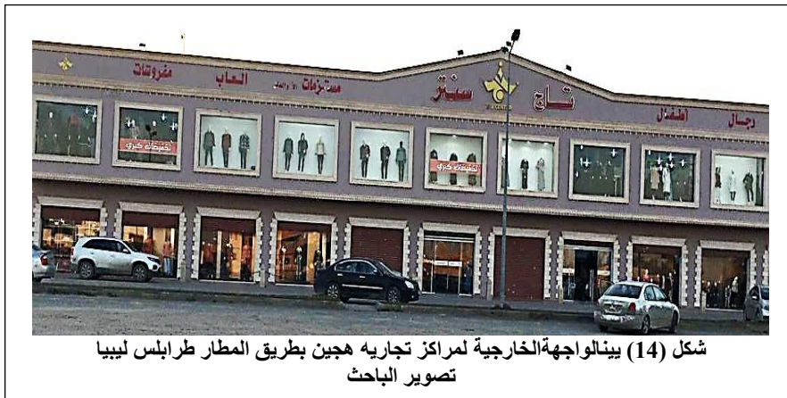
شكل (14) بينالواجهةالخارجية لمراكز تجاريه هجين بطريق المطار طرابلس ليبيا

وقد استحدث نوع ثالث يجمع بين الشكلين السابقين، يسمى بالهجين، وتكون واجهاته مفتوحة من جانب واحد، أو رؤية بواجهتين أو بثلاث واجهات، وأشير إلى أنّ هذا النوع من المراكز له عدت أدوار وتجد له نوافذ عرض على الشارع، وهذه التصميمات غير منطقية من الناحية التصميمية لنوافذها كون الزبون يصعب من خلالها أن يتعرّف عن السلع، وتحديد نوعيتها وخامتها (2) شكل (14).