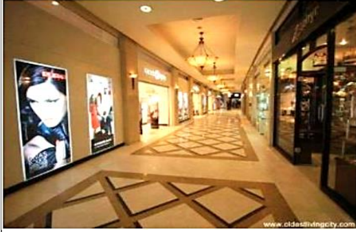
شكل (1) ممرات المراكز التجارية المقفلة

شهد القرن العشرون ظهور المراكز التجارية المعاصرة بشكل كبير في أمريكا وأوروبا، وأصبحت مظهرًا جديدًا في عملية التسويق والتسوق، حيث انتشرت في المدن ثم انتقلت إلى الضواحي والمناطق الريفية. ولقد كان