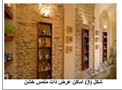
شكل (3) اماكن عرض ذات ملمس خشن