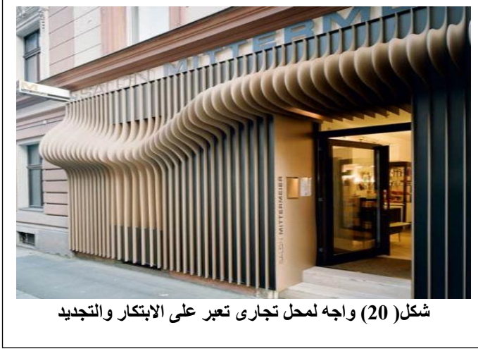
شكل (20) واجه لمحله تجاري تعبر على الابتكار والتجديد

ثانياً- نوافذ العرض بالمراكز التجارية: استخدام نوافذ العرض يرجع إلى حقبة تاريخية قديمة، والتي استخدمت في عرض المنتجات في العهد اليوناني والروماني القديم، من خلال نوافذ عرض شبه العربة