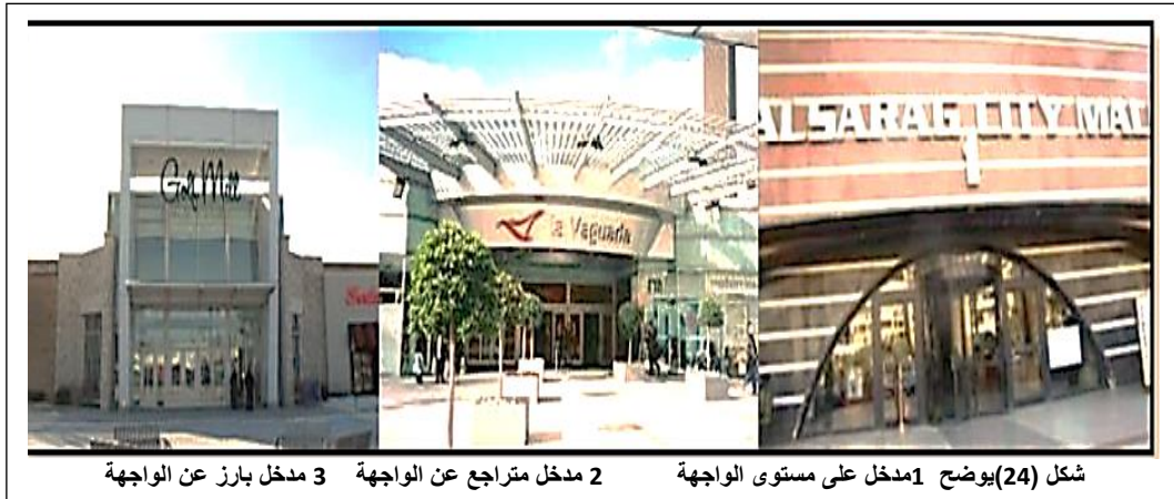
شكل (24) يوضح 1مدخل على مستوى الواجهة 2 مدخل متراجع عن الواجهة 3 مدخل بارز عن الواجهة

الزجاج المستخدم في أبواب الدخول: قد يكون شفافاً كلياً مثل الأبواب المصنوعة من الزجاج السيكريت، وقد يكون مصمماً و به فتحة من الزجاج تطل على الداخل، كما يمكن أن يكون الباب من