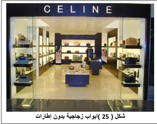
شكل ( 25 ) ابواب زجاجية بدون إطارات

الزجاج المؤطر بإطارات خشبية أو معدنية، ومن المهم أن يكون غير حاجب للرؤية. ويجب أن يكون الباب مصنوعاً من مادة قوية؛ حتى تتحمل الصدمات، وحتى لا يتأثر بالرطوبة أو فرق درجات الحرارة بين الداخل والخارج إذا كان الباب يفصل بين البيئة الداخلية والخارجية، وأن شكل الباب والمادة المستخدمة في صنعه يتحكم فيها الغرض المطلوب منه (1) ويعد من أهم مكونات واجهات المحلات التجارية، وتتعدد أنواعها واستخداماتها فهناك الزجاج العادي، الذي يتراوح سمكه ما بين 6، 10، 12 مم، فكلما زاد عرض مسطح الزجاج كلما تطلب سمك أكبر، وهو لا يتحمل الصدمات، ويلزم لتركيبه