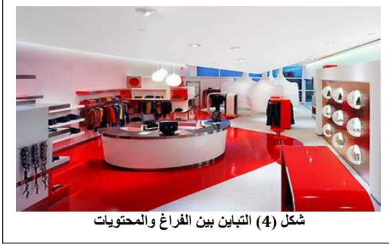
شكل (4) التباين بين الفراغ والمحتويات

خامات مختلفة يعطي كل منها قيمتها الخاصة، واستخدام واختيار الخامات خارجياً كمدخل أو محدّدات خارجية لفرغ بيع أو عرض يكون هذا باعتبارات قوة تحملها، وهنا يجب أن تؤدي دوراً وظيفياً وجمالياً، واستخدام الملامس سواء خارجياً أو داخلياً يكون لإيجاد التباينات المفيدة، والتي تخدم عمليات العرض المختلفة. (1)