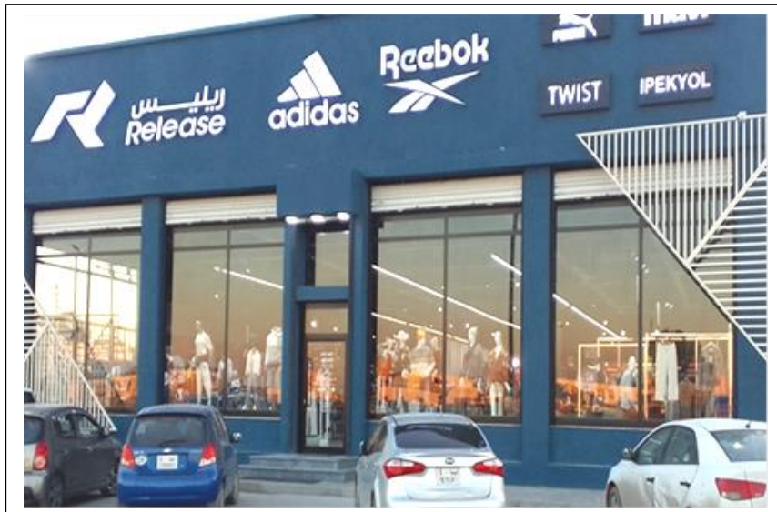
شكل (22) نوافذ العرض المفتوحة تصوير الباحث بمنطقة طريق المطار طرابلس ليبيا

وأرفف العرض الداخلي، وقد زاد الاهتمام بالتصميم الداخلي لمنطقة البيع في المحل التجاري بدرجة كبيرة من حيث التصميم والخامات المستخدمة، ووسائل وأساليب العرض والإضاءة، وتعد نافذة العرض بمثابة اتصال بين البيئة الداخلية والعملاء المحتملون مع تعزيز استراتيجيات البيع، وذلك لأن نافذة العرض المفتوحة تعطي للعميل فرصة الاستمتاع برؤية الداخل وهو في الخارج، وبالتالي تساعد على المزيد من الجذب للمارة في الطريق. وتقلل الواجهات المفتوحة من الخلف الاعتماد على نافذة العرض في عرض السلع، حيث تعرض نافذة العرض الحيز الداخلي بالكامل، ولا يتم التركيز على سلعة معينة شكل (22)، ولذلك يمكن الاستعانة ببعض المستويات المختلفة الارتفاعات والأحجام،