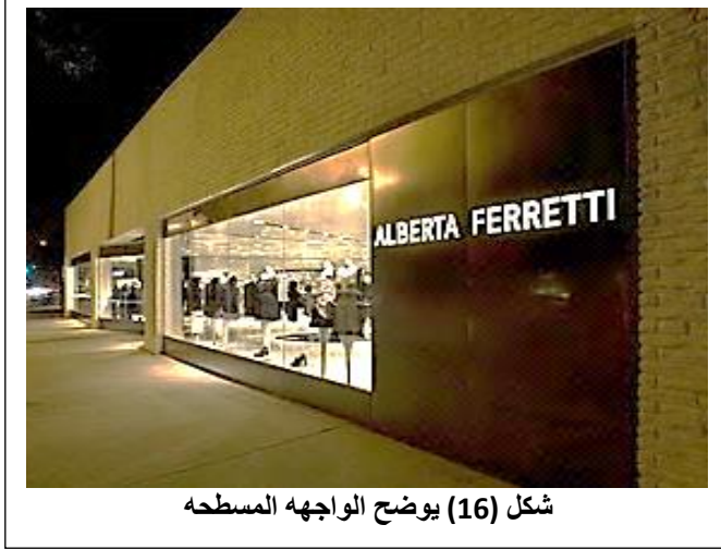
شكل (16) يوضح الواجهه المسطحه

إنَّ الواجهات تتيح للمارة فرصة التدقيق في السلع مستظلين بعيداً عن زحام المارة، كما أنَّ الواجهة تزيد من مسطح العرض الخارجي، مما يعوّض فقدان جزء من المساحة الداخلية للمحل، وتساعد المستهلك المار على رؤية أكبر قدر من السلع أثناء الدوام الرسمي، أو بعد ساعات العمل الأساسية