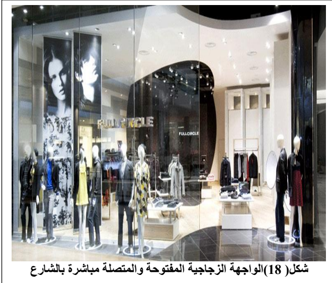
شكل (18) الواجهة الزجاجية المفتوحة والمتصلة مباشرة بالشارع

والمتصلة مباشرة بالرصيف، حيث يظهر حيز المحل الداخلي من خلال النافذة الزجاجية واضحاً جلياً بكل تفاصيله، وبهذا يحدث تداخلاً قوياً بين الداخل والخارج، ممّا يشجّع من خلاله المتسوقين على الدخول والتعرّف عليه، والتسوق بشكل فوري وسريع، ويكثر هذا التصميم بصفة أساسية في المحال التي تباع السلع الكبيرة مثل الموبيليا، أو