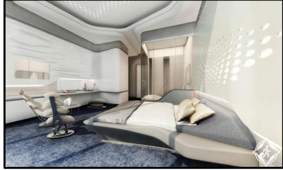
شكل رقم 1: فندق ابوس دبي