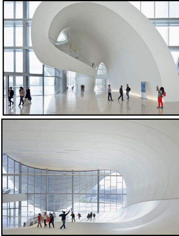
شكل رقم 2: مركز حيدر عليف أذربيجان