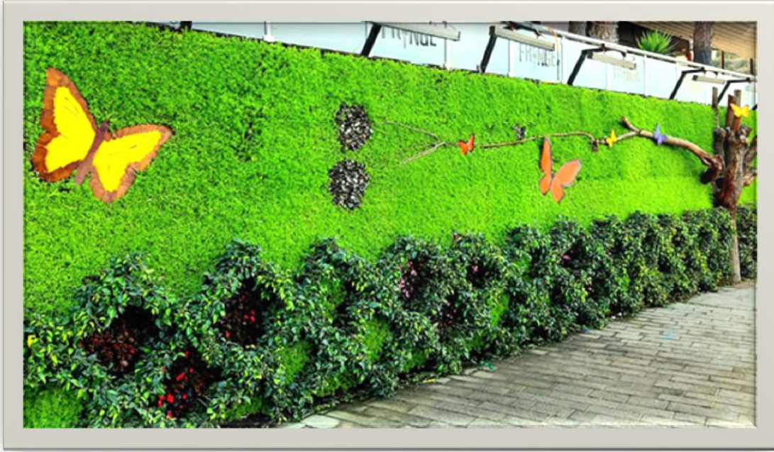
صورة رقم (4) حديقة الفراشات