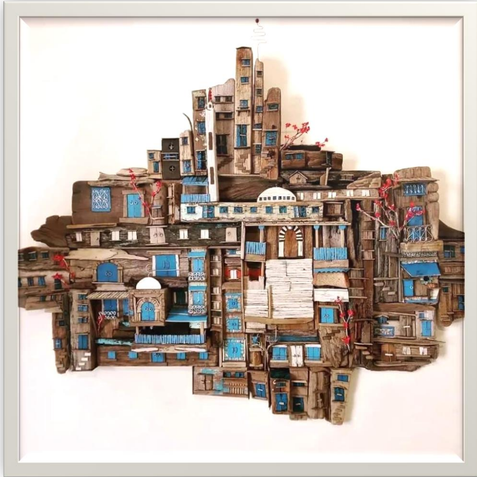
صورة رقم (1) مجسم مدينة ابو سعيد