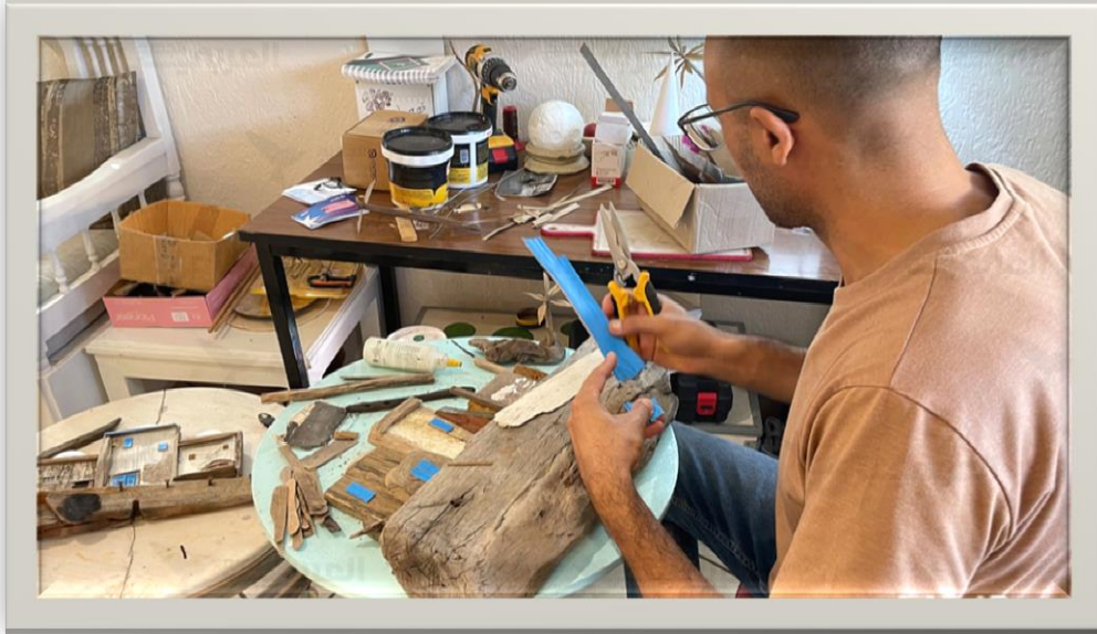
صورة رقم (2) توضح استخدام الفنان لبقايا حطام اخشاب المراكب