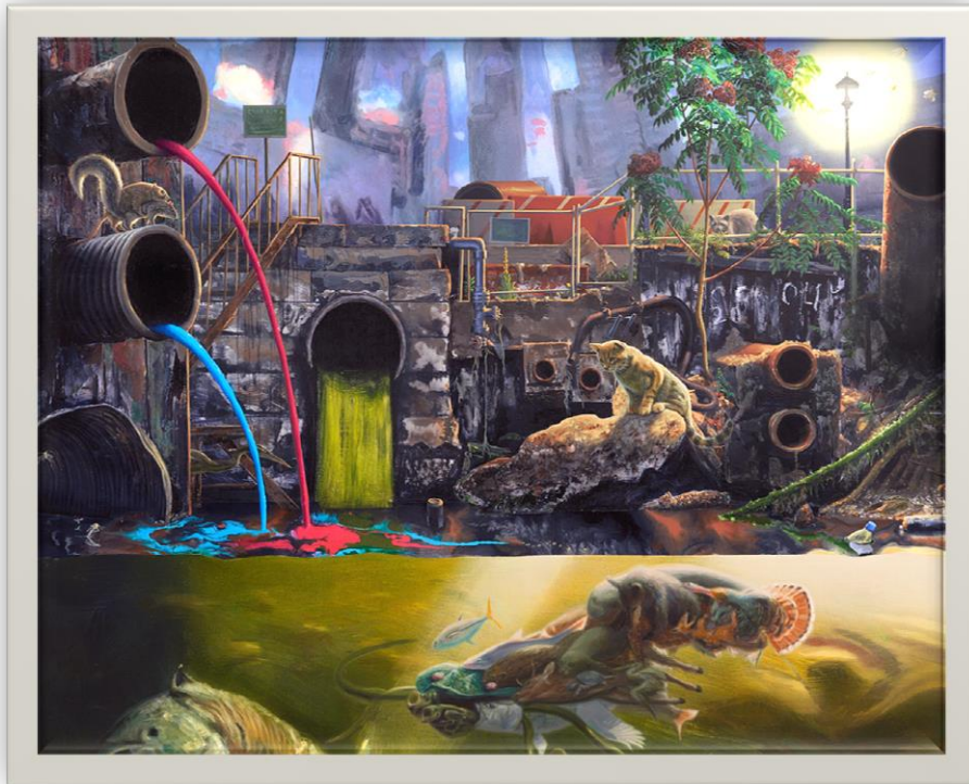
صورة (7) لوحة لفنان الكسيس روكمان 2013