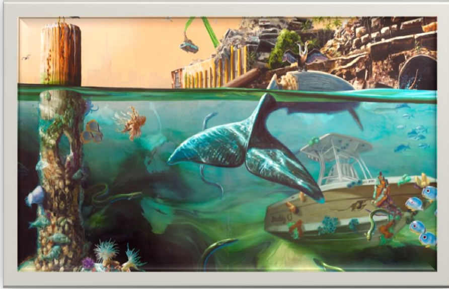
صورة (6) لوحة لفنان الكسيس روكمان 2014